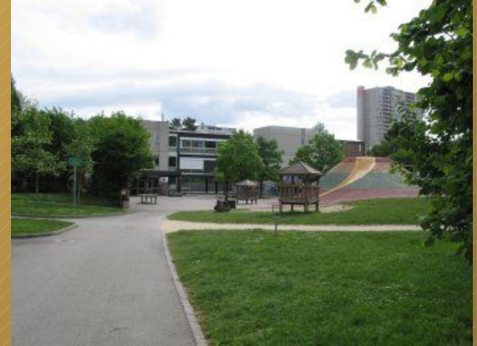
Les Racettes, Onex